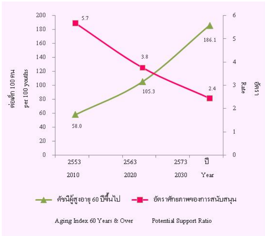
FIGURE 15 THE PROJECTION OF AGING INDEX 60 YEARS & OVER AND POTENTIAL SUPPORT RATIO: 2010 - 2030

แหล่งข้อมูล: การคาดประมาณประชากรของประเทศไทย พ.ศ. 2543 - 2573