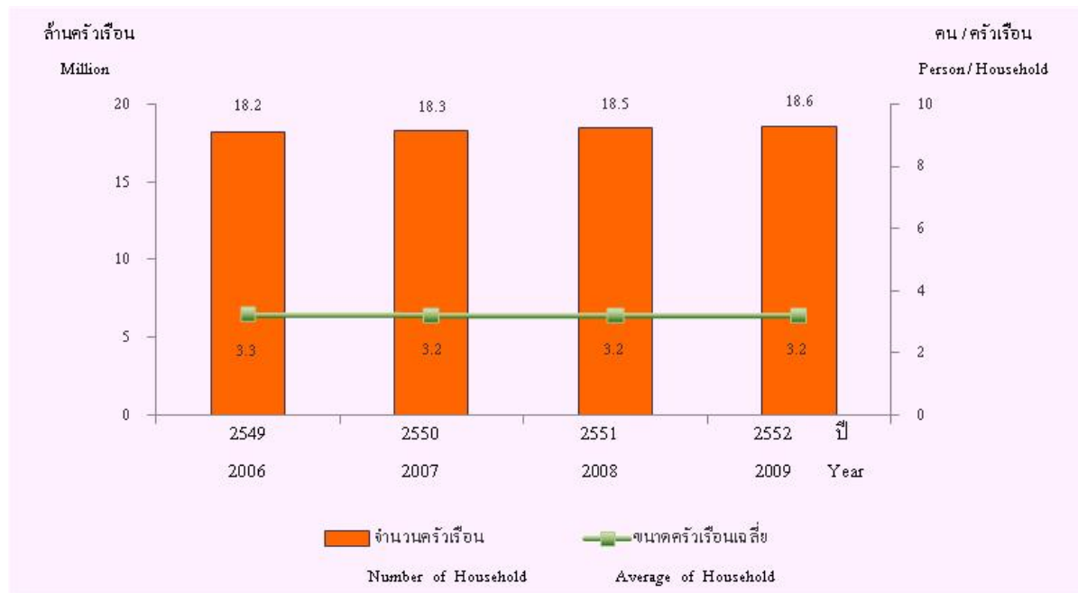
FIGURE 17 NUMBER AND AVERAGE OF HOUSEHOLD: 2006 - 2009

แหล่งข้อมูล : ประมวลผลจากข้อมูลการสำรวจภาวะการทำงานของประชากร ไตรมาส 3: กรกฎาคม-กันยายน พ.ศ. 2549 - 2552 สำนักงานสถิติแห่งชาติ